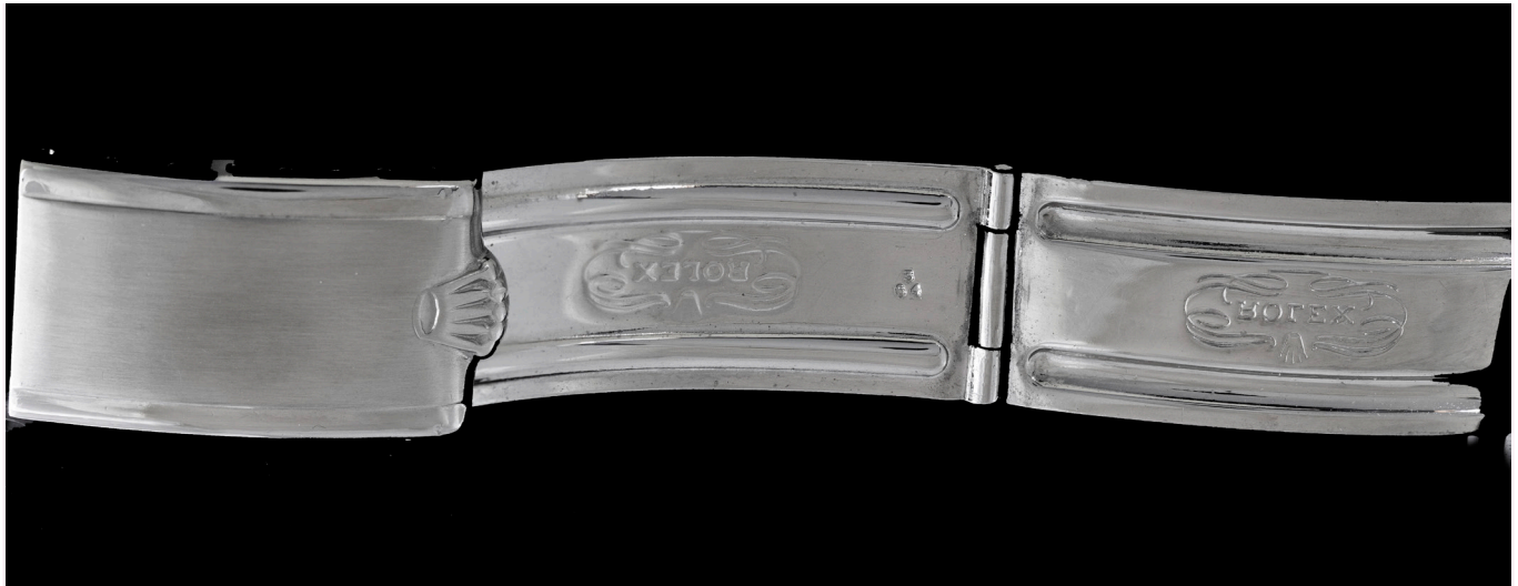
Jubilè ripiegato, terminali 55, produzione 3/64.